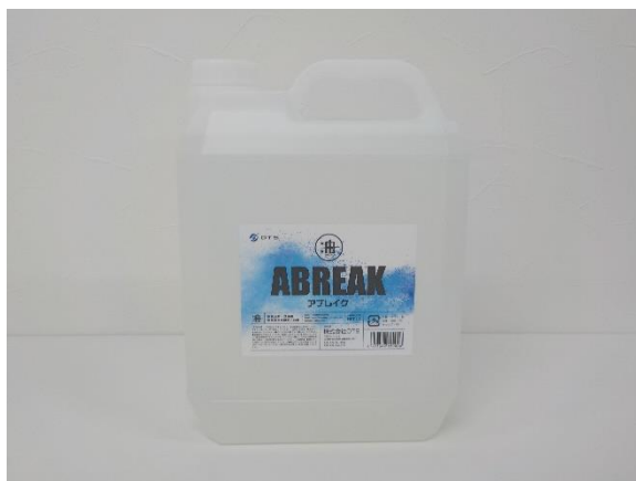
※アブレイク本体(原液)